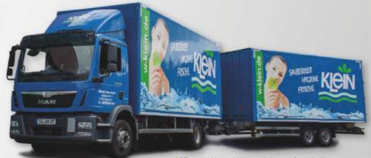
Effizienter. Unsere LKWs mit Anhänger für mehr Kapazität