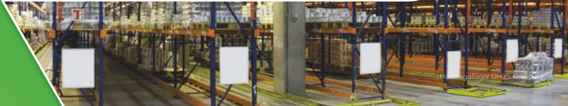
Hochregallager DHYS Group

Über unsere europäischen Partner haben wir ein enorm starkes Vertriebsnetz aus familiengeführten Betrieben. Für Sie bedeutet das länderübergreifende Flexibilität ohne Sprachbarrieren und zudem Zugriff auf über 80.000 Artikel. So können wir Ihre Standorte optimal versorgen.