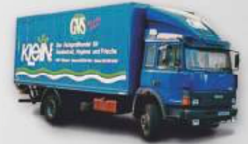
Einer der ersten LKWs im Corporate Design von 1994